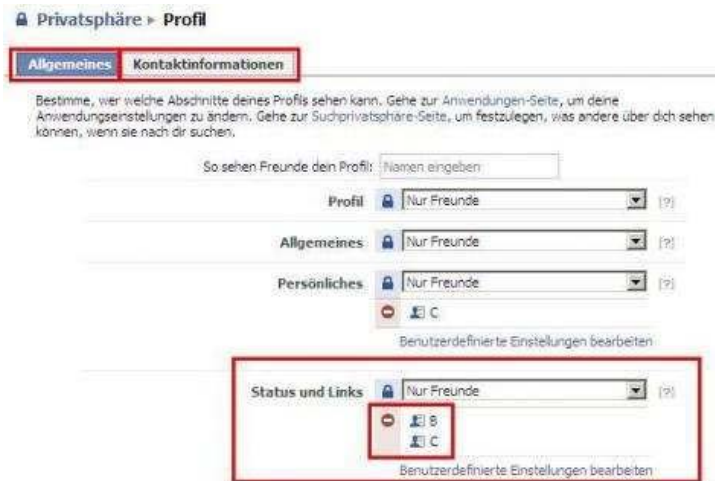
Profil-Privatsphäre auf Facebook einstellen

Facebook bietet Dir sogar die Möglichkeit der Qualitätssicherung an! Wenn Du kurz gegenchecken willst, ob Du alles richtig eingestellt hast, gibst Du einfach einen Namen Deiner Kontakte ein und überprüfst im „Ansehen als“-Modus, wie Dein Kontakt Deine Seite sieht.