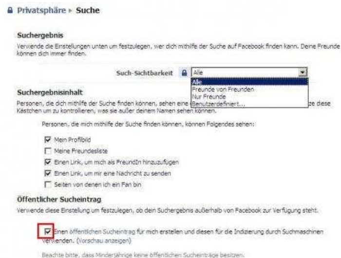
Suche auf Facebook einschränken

Auch bei der Suche kannst Du sehr viel einschränken. Nimm z. B. am besten den Haken im „öffentlichen Sucheintrag“ gleich raus. Ausser Du möchtest, dass man sich auf Dein Facebook-Profil googeln kann.