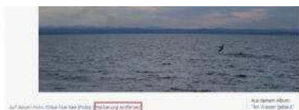
Facebook Markierung auf Foto entfernen

“Untaggen“ – also Markierungen auf Fotos entfernen – ist auch nicht schwer. Einfach auf das Bild gehen und neben dem eigenen Namen „Markierung entfernen“ anklicken.