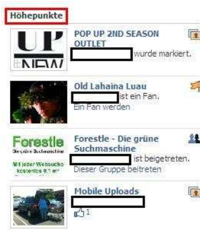
Höhepunkte auf Facebook

Wie Du siehst, sind unter „Höhepunkte“ auch weitere Anwendungen vertreten. Also entscheide selbst, wie sehr Dein Leben zum Newsticker wird. Neulich konnte ich z. B. die Video-Ultraschallaufnahme eines mir völlig unbekanntes Fötus sehen.